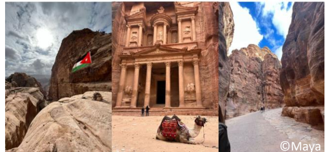
Ruinenstätte Petra in Jordanien

Im Vergleich zu unserer Hochschule waren die Vorlesungszeiten an der GJU viel kürzer. Ein Modul hatte zwei Sessions pro Woche, was das Lernen entspannter und strukturierter machte. Was ich richtig gut fand, war das Bewertungssystem. Die Bewertung eines Moduls bestand nicht nur aus einer einzigen Prüfung, sondern aus mehreren Teilen. Es gab ein Midterm und ein Final Exam, sodass man schon bis zu 60 Punkte vor der finalen Prüfung sammeln konnte. Das nahm viel Druck raus.