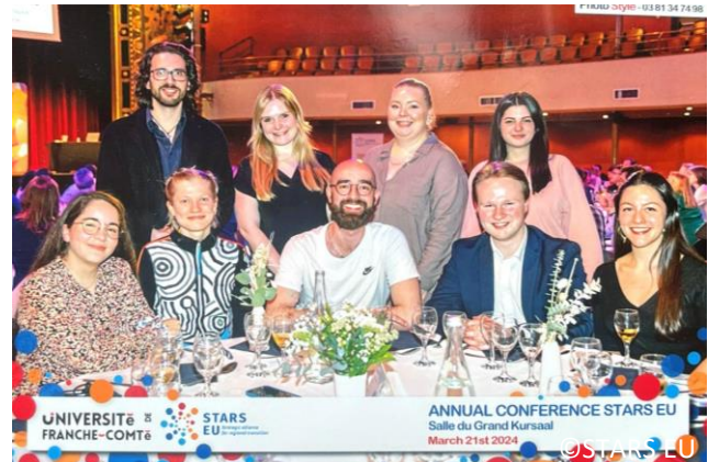
Stars EU Abendessen in Besançon

Das gemeinsame Ausarbeiten unserer Strategie mit anderen Mitgliedern des Student Boards hat mir viel Spaß gemacht. Am spannendsten bisher fand ich den Einblick in die Arbeitsgruppe Curriculum Lab im Rahmen der diesjährigen STARS EU Konferenz an der Université Franche-Comté sowie den Austausch mit allen Teilnehmenden auf Augenhöhe.