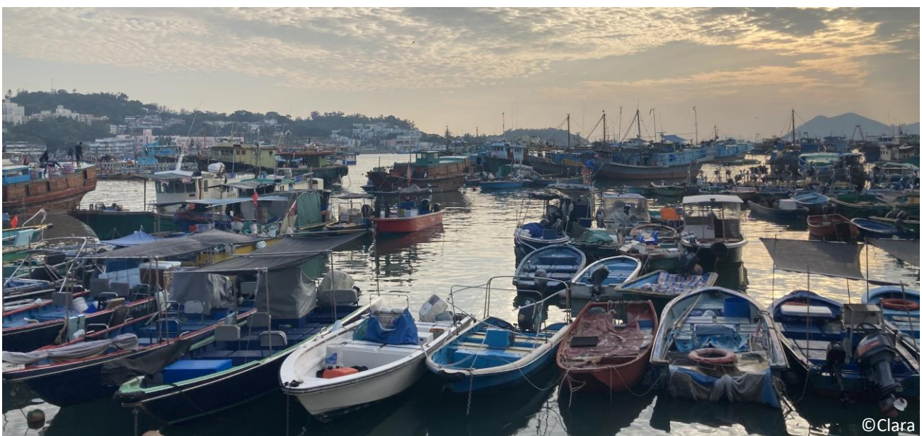
Cheung Chau Insel

Das Modul hat perfekt auf ein paar Vorkenntnisse des Studiums in Bremen aufgebaut und dann zu einem breit gefächerten Logistikkwissen geführt. Beide Module würde ich auf jeden Fall weiterempfehlen.