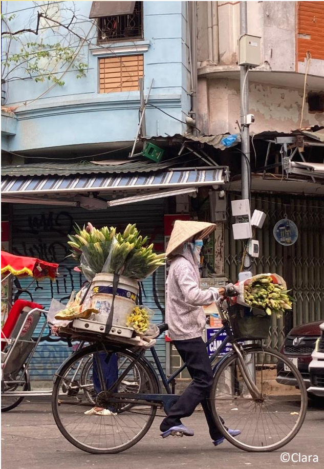
Blumenverkäuferin in Vietnam